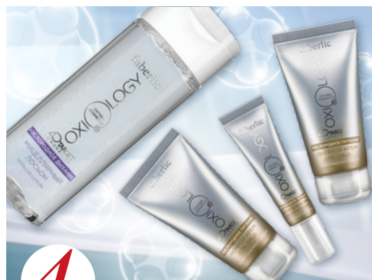
4 цена набора в каталоге 30 р.