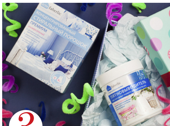
3 цена набора в каталоге 30 р.