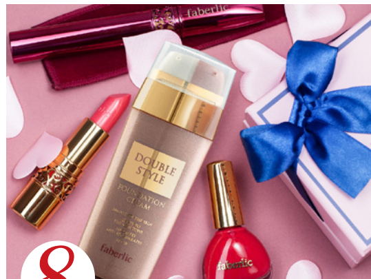
8 цена набора в каталоге 42 р.