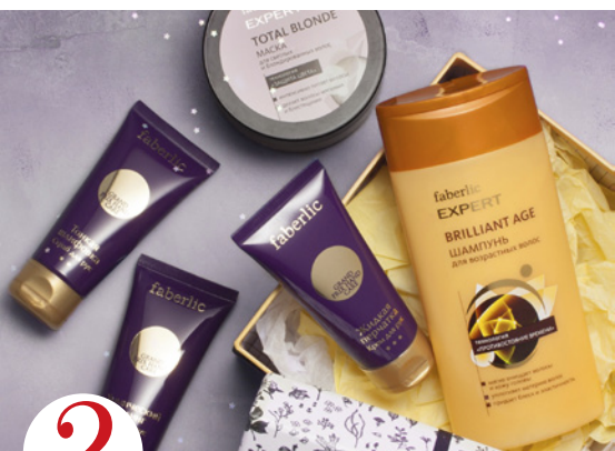
2 цена набора в каталоге 26 р.

Оплатите заказ на сумму от 40,49 р. по каталогу №16/2017 (в ценах каталога) и получите в следующем заказе всего за 0,1 руб. концентрированный стиральный порошок 800 г. – универсальный (арт. 11525) или для цветного белья (арт. 11526).