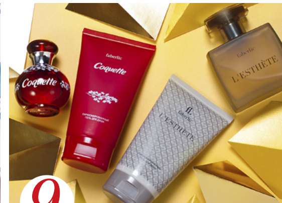
9 цена набора в каталоге 70 р.