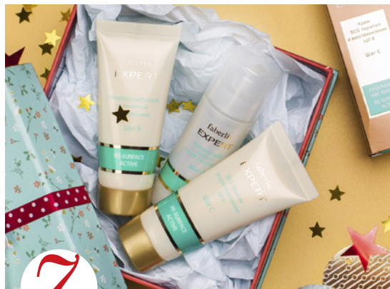
7 цена набора в каталоге 40 р.