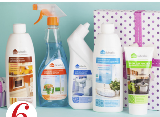
6 цена набора в каталоге 33 р.