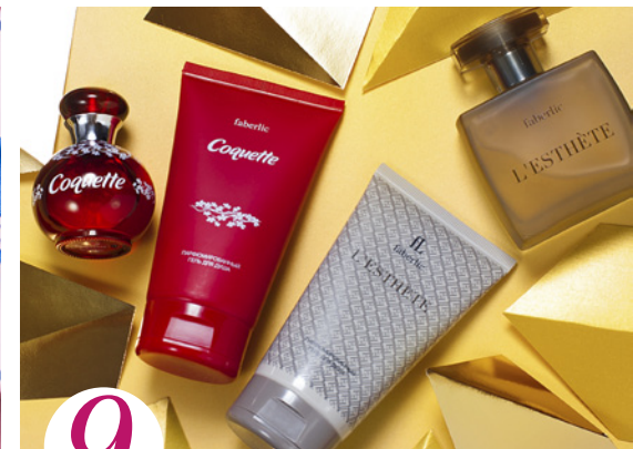
9 цена набора в каталоге 72 р.