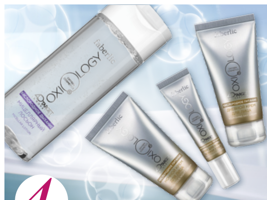
4 цена набора в каталоге 30 р.