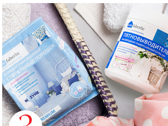
3 цена набора в каталоге 1 050 р.