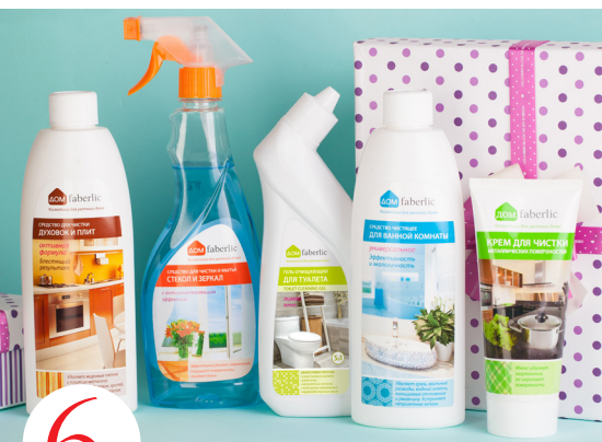
6 цена набора в каталоге 1 250 р.