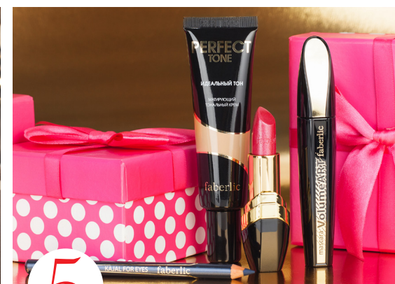
5 цена набора в каталоге 1 650 р.