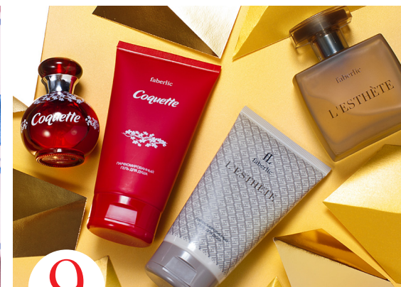
9 цена набора в каталоге 3 060 р.