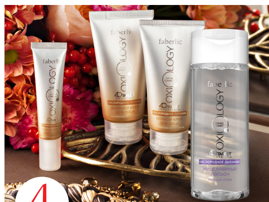
4 цена набора в каталоге 1 140 р.