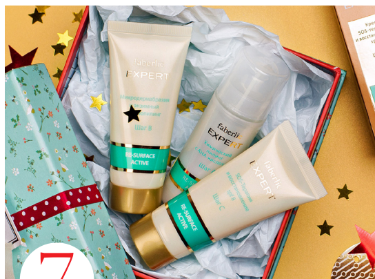
7 цена набора в каталоге 1 900 р.