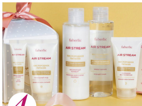
4 цена набора в каталоге 30 р.