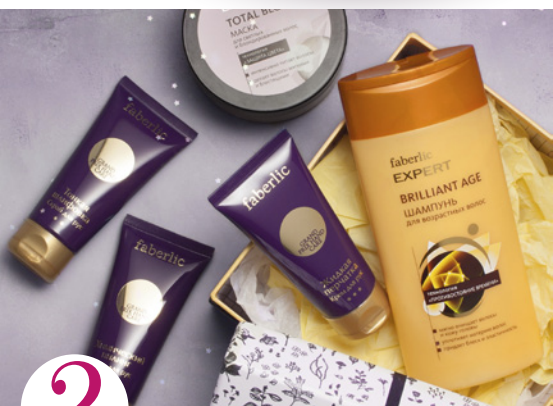
2 цена набора в каталоге 26 р.

Оплатите заказ на сумму от 40,49 р. по каталогу №13/2017 (в ценах каталога) и получите в следующем периоде аромат всего за 0,10 р. парфюмерную воду для женщин Beauty Cafe Caprice, 60 мл (арт. 3015)