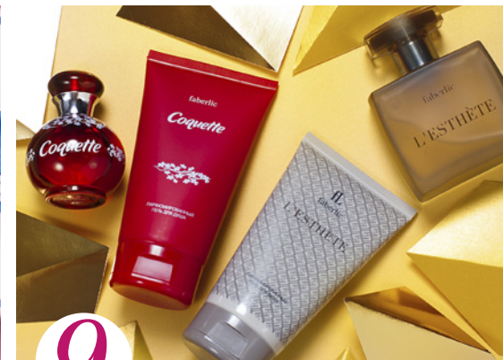
9 цена набора в каталоге 70 р.