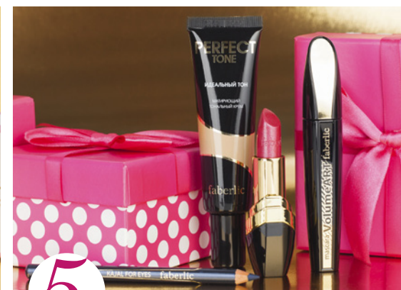
5 цена набора в каталоге 32 р.