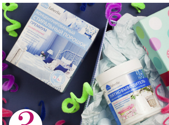
3 цена набора в каталоге 30 р.