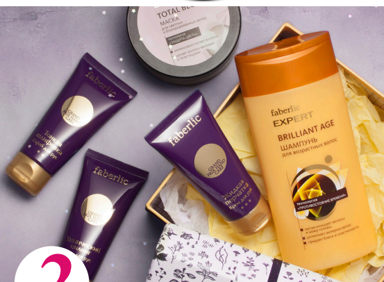
2 цена набора в каталоге 26 р.

Оплатите заказ на сумму от 35 р. по каталогу №12/2017 (в ценах каталога) и получите в следующем периоде всего за 0,3 р.: тушь для ресниц «Кошачий взгляд» (арт. 5461), косметичку женскую (арт. 9001), губную помаду «3D поцелуй» (любой оттенок на выбор).