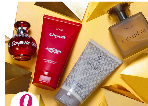
9 цена набора в каталоге 70 р.