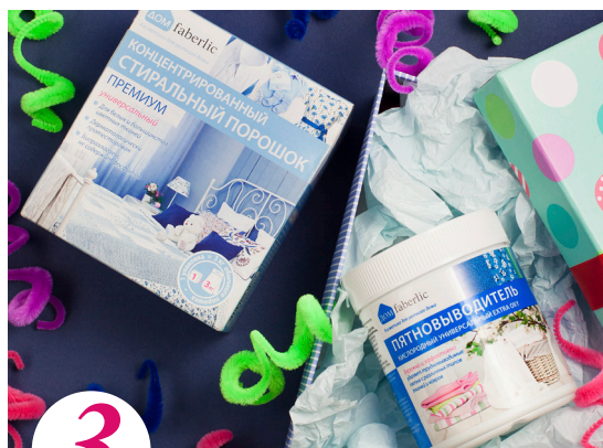
3 цена набора в каталоге 30 р.