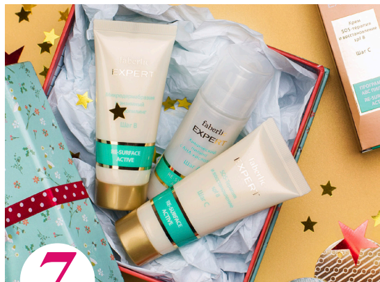
7 цена набора в каталоге 40 р.