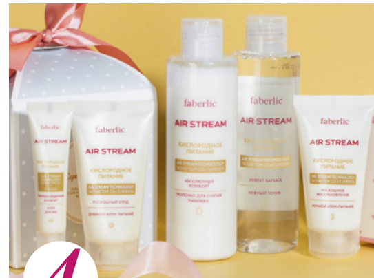
4 цена набора в каталоге 30 р.