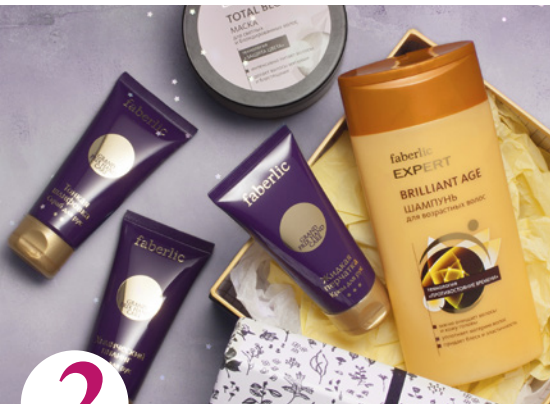
2 цена набора в каталоге 26 р.

Оплатите заказ на сумму от 35 р. по каталогу №11/2017 (в ценах каталога) и получите в следующем периоде всего за 0,2 руб. набор: средство для чистки духовок и плит (арт. 11119) и концентрированное средство для мытья посуды с биоэнзимами с ароматом яблок (арт. 11194).