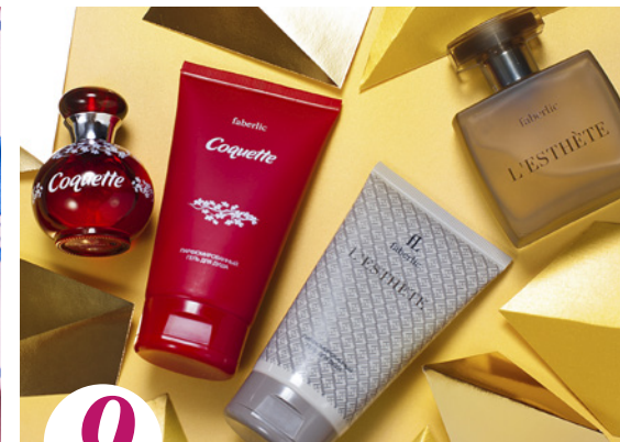
9 цена набора в каталоге 70 р.