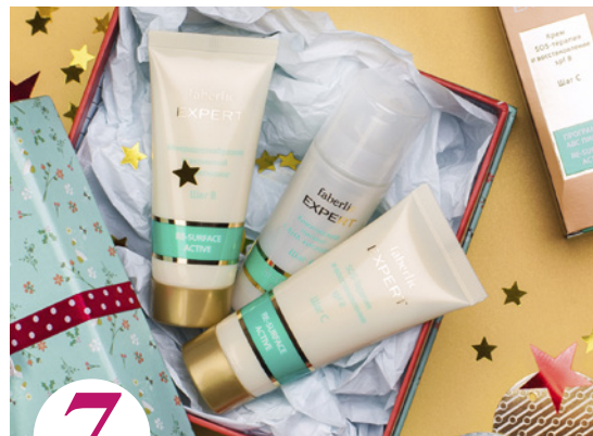
7 цена набора в каталоге 40 р.