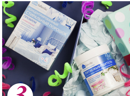
3 цена набора в каталоге 30 р.