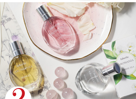
2 цена набора в каталоге 25 р.

Оплатите заказ на сумму от 45 р. по каталогу №10/2019 (в ценах каталога) и получите всего за 0,4 руб. в следующем заказе набор косметики для дома: стиральный порошок концентрированный универсальный (арт. 11525) или для цветного белья (арт. 11526) + ультракондиционер с аромакапсулами (арт. 11038, арт. 11265) или кондиционер-бальзам для белья (арт. 11264) на выбор.