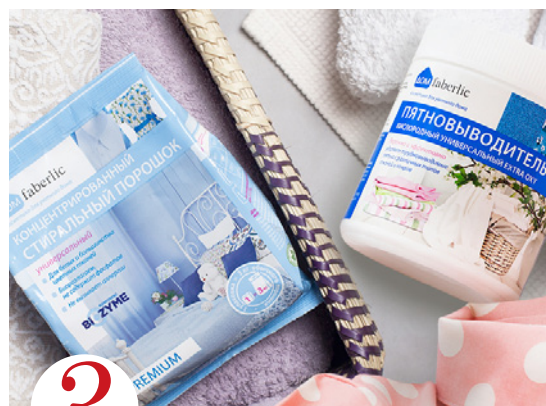
3 цена набора в каталоге 26 р.