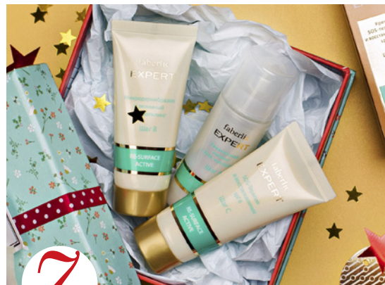
7 цена набора в каталоге 42 р.