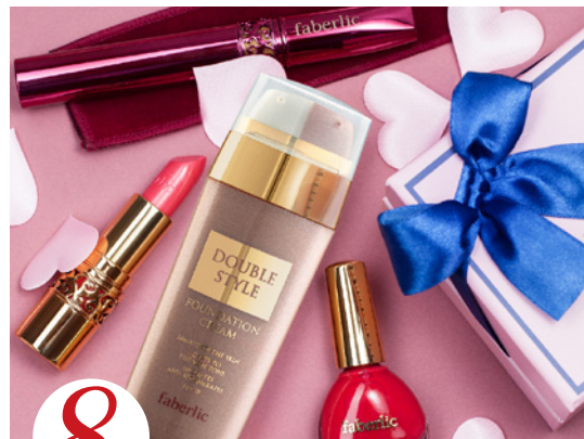
8 цена набора в каталоге 60 р.