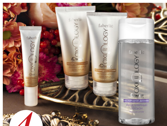
4 цена набора в каталоге 30 р.