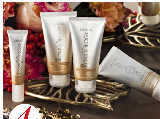
4 цена набора в каталоге 30 р.