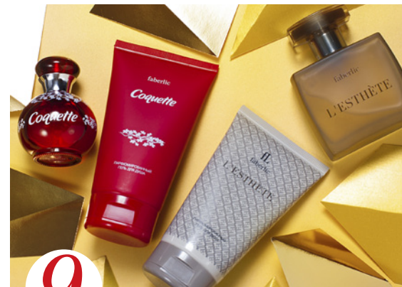
9 цена набора в каталоге 3 060 р.