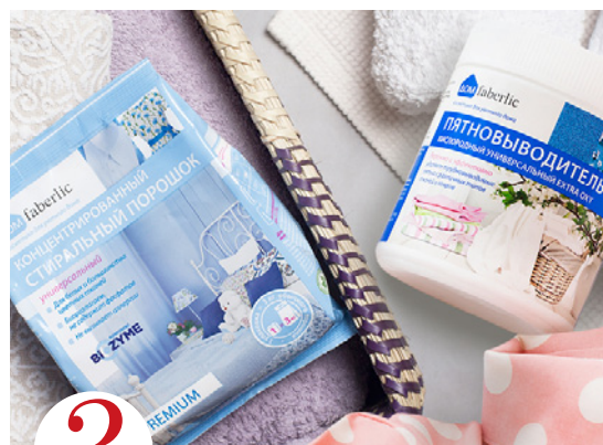
3 цена набора в каталоге 1 050 р.