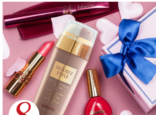
8 цена набора в каталоге 2 280 р.